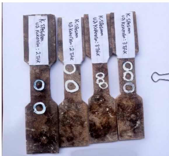
Gambar 2. Hasil Pengujian Uji Kekerasan

Hasil Uji kekerasan (brinell hardness test /BHN) yang menggunakan indentor berupa bola baja mempunyai diameter 2,5 mm dengan pembebanan 5,625kgf. Dari penelitian yang telah dilakukan akan di bahas dari hasil uji tarik dan uji kekerasan bahan alternatif dashboard mobil dengan menggunakan serat serabut kelapa dan serbuk kayu jati dengan resin polyester 157 sebagai penguat serta fraksi volume dimana setiap spesimen akan di ujikan Seperti gambar di bawah ini: