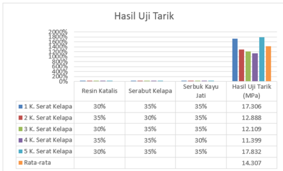
Gambar 3. Grafik Hasil Pengujian Uji Tarik

Dari Hasil Pengujian Uji Tarik dan Uji kekerasan Brinell dengan Fraksi Volume untuk serat serabut kelapa 35% serbuk kayu jati 35% resin dan katalis 30% Didapatkan Dengan Hasil Rata Rata 14.307 Untuk pengujian Uji Tarik Dan untuk Pengujian Uji Kekerasan Brinell Didapatkan dengan Hasil Rata Rata 14.54 berikut Grafik Hasil pengujian Uji Tarik Serta Uji kekerasan.