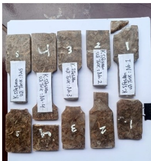
Gambar 1. Hasil Uji Tarik

Hasil Uji Tarik Uji tarik komposit adalah pengujian mekanis untuk mengukur kemampuan material komposit yang menahan gaya tarik hingga putus, bertujuan untuk menentukan sifat seperti kekuatan pada tarik ( tensile strength ), modulus serta elastisitas ( Young's modulus ), serta regangan ( elongation ). Pengujian ini juga mengikuti standar seperti ASTM D3039 atau ISO 527-4/5 menggunakan mesin uji universal yang menarik spesimen secara bertahap hingga gagal, menghasilkan data tegangan-regangan untuk analisis kekuatan material dalam desain rekayasa.