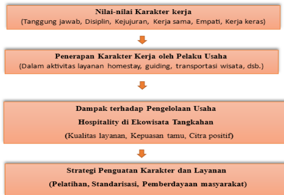
Gambar 1. Model Konseptual Penelitian.