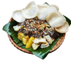
Gambar 1. Ilustrasi Tahu tek

Secara visual, desain buku menggunakan palet warna hangat seperti merah bata, coklat, dan krem untuk menciptakan nuansa khas Surabaya yang hangat dan membumi. Tipografi yang digunakan bergaya modern namun tetap memiliki sentuhan klasik agar sesuai dengan tema tradisional. Tata letak dibuat dinamis dengan perpaduan teks dan ilustrasi agar pembaca tidak mudah bosan. Buku ini juga menampilkan elemen-elemen pendukung seperti omamen khas Surabaya dan ilustrasi suasana pasar tradisional untuk memperkuat konteks budaya. Berikut beberapa contoh hasil gambar ilustrasi realis yang akan digunakan di dalam buku, untuk menyamakan hampir dengan tampilan aslinya.