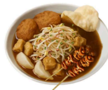
Gambar 2. Ilustrasi lontong balap

Melalui buku ilustrasi ini, pembaca tidak hanya disuguhkan visual yang menarik, tetapi juga diajak untuk memahami nilai dan cerita yang terkandung dalam setiap makanan. Proses membaca menjadi pengalaman edukatif dan emosional yang memperkenalkan kembali jati diri Surabaya melalui kulinernya. Dengan demikian, hasil perancangan ini dapat berfungsi sebagai media pelestarian budaya lokal yang relevan dengan gaya hidup modern dan dapat digunakan dalam kegiatan pendidikan, promosi wisata, maupun dokumentasi budaya.